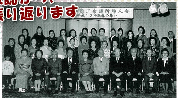
▲平成12年1月「新春の集い」 来賓の方々と多くの会員で記念撮影