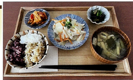
▲「一汁三菜のバランスのいい定食で、心も体も満たされて欲しいです」

店内は、ナチュラルでシンプルな空間です。おひとりでもグループでも、ゆったりとした時間を過ごして頂けると思います。それから、不定期ではありますが、塩竈などで活動している方のアート作品を展示しています。お食事を待っている間に楽しんで頂けるのも当店の特徴です。お気軽にご来店ください、どうぞよろしくお祈りします。