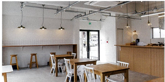
▲天井の高い広々とした明るい店内