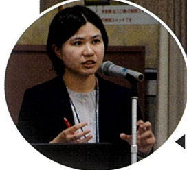
▲海業を率先して推進している地区の説明などがありました