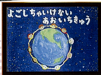
▲環境ゴミ問題 「作文・絵画コンクール」 過去の市長賞受賞作品より