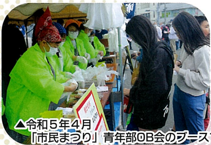
△令和5年4月 「市民まつり」青年部OB会のブースで