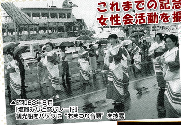
△昭和63年8月 「塩釜みなと祭パレード」 観光船をバツクに“おまつり音頭”を披露

「年の歴史と伝統を継承し、邁進してまいります。」とのメッセージをいただきました。