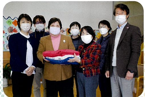
▲令和4年3月 特別養護老人ホームへ「古布」を寄贈