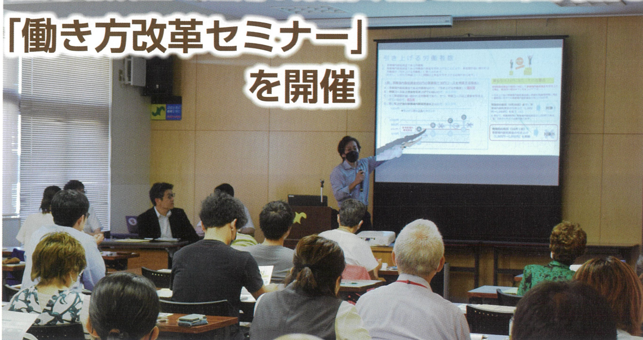
▲生産性の向上にむけた助成金活用などについて説明がありました

8月9日、当所中小企業相談所が、会員企業の業務改善と生産性向上を目的とした「働き方改革セミナー」を開催しました。会員事業所から経営者や人事担当者など34名が参加し、労働契約書や36協定届の作成ポイント、厚生労働省の各種雇用助成金の申請手続きについて学びました。