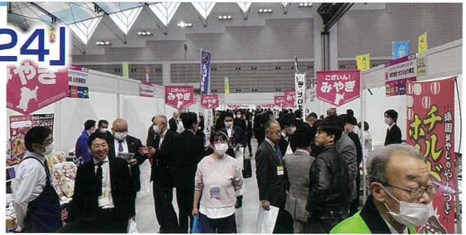
▲前回のビジネスマッチ東北。毎年開催されており、バイヤーやサプライヤーから好評を得ている商談会です

この展示商談会は、「食と農」をはじめ「情報・IT」や「ソリューションビジネス」など10のジャンルで展示エリアを構成し、去年は約500の企