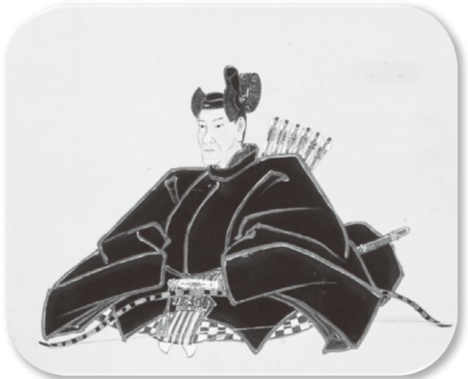
▲伊達綱村公肖像 [東園寺蔵]