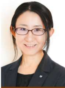
公益社団法人 塩釜青年会議所 第49代理事長