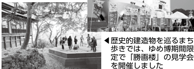
◀歴史的建造物を巡るまち歩きでは、ゆめ博期間限定で「勝画楼」の見学会を開催しました