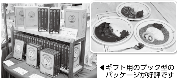
◀ギフト用のブック型のパッケージが好評です

今年3月には、レトルトも発売。各メディアにも取り上げられ、大きな反響をいただきました。市内10店舗で販売されています。