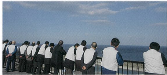
◀ A L P S 処理水放出状況の視察