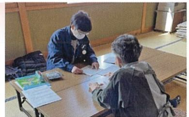
▶ 島に居ながら相談に行けると好評でした

会員は作業の合間を利用して相談に訪れ、「塩竈市魚市場に水揚げができないことによる影響や、漁獲量の減少で将来が不安だ」、「カキの出荷量が減っている」、「高齢化が進んでいて廃業予定の事業