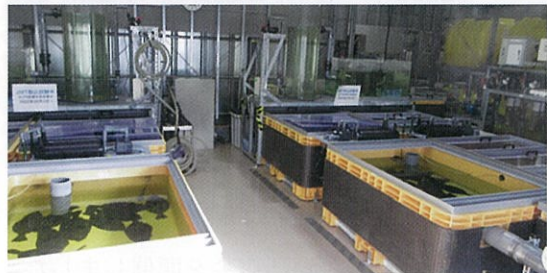
◀ ヒラメとアワビの飼育状況の見学