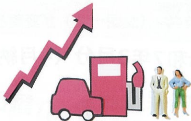
ガソリン価格の高騰は様々な業界で大きな影響が