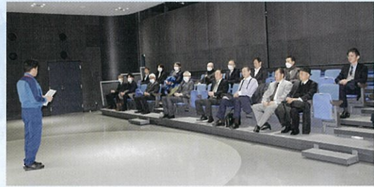
◀ 廃炉資料館では映像で経緯の説明

※使用済み燃料：発電に使用された後の燃料棒。建屋内の使用済み燃料プールに保管。 ※燃料デブリ：原子炉内部にあった燃料が溶け、さまざまな構造物と混じり固まったもの。