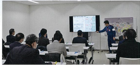
◀ 発電所構内で作業の進捗状況などの説明