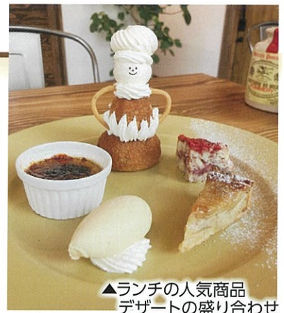
▲ランチの人気商品 デザートの盛り合わせ