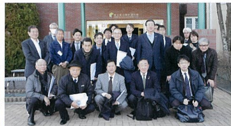
◀ 左の2枚・2号機3号機を背景に、右・廃炉資料館で