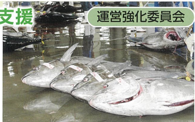
▲水産業界のイメージ向上に努めます

協議の結果、新年度は「次代を切り拓く活力ある地域経済を目指していく」ことを基本方針とすることや、まちの活力強化に向けて、「水産の町塩竈」のイメージ向上と業界の元気アップにつながる事業を展開することとし、予算規模を2億5,961万円とする」ことになりました。